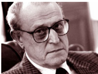
W. F. Hermans

Elnederlandigo de ‘De elektriseermachine van Wimshurst’. Rakonto unuafoje aperinta en la rakontaro ‘Een wonderkind of een total loss’ (Mirinfano aŭ kompleta perdo) en la jaro 1967.